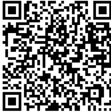
網路報名 QR code