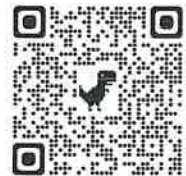
FEIAP 2024 大會網站