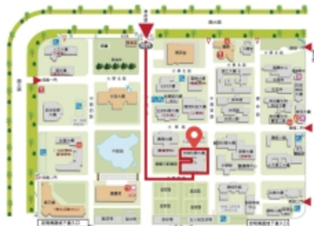
【中興大學 作物科學大樓】

會員年會 16:40-17:40 臻愛會館 東方明珠廳2F (台中市烏日區高鐵路三段168號)