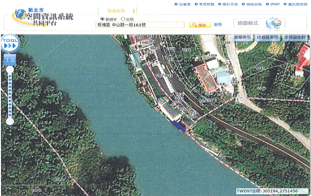
馥蘭朵烏來度假酒店私設建造物設施與河川區域線相對位置