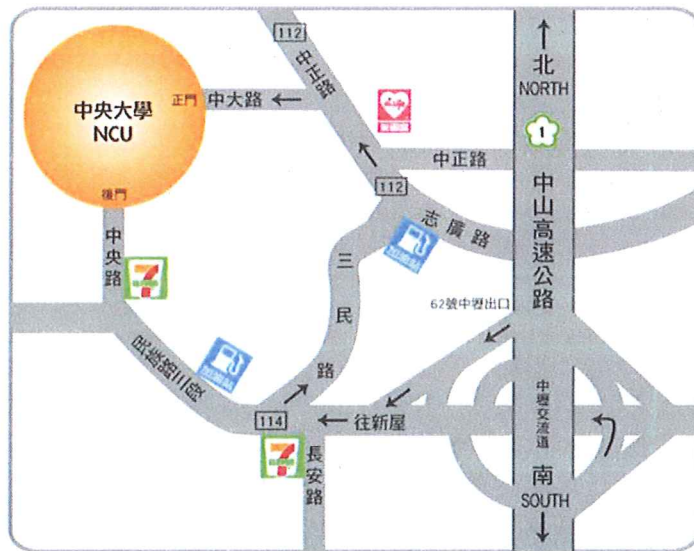
中央大學 交通路線圖

台鐵中壢站下車，前站出站後轉乘市區公車或計程車（車程 20~30 分鐘）抵達本校。請參閱市區公車搭乘說明。