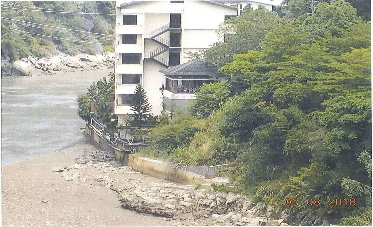
馥蘭朵烏來度假酒店私設建造物設施在南勢溪低水位現況