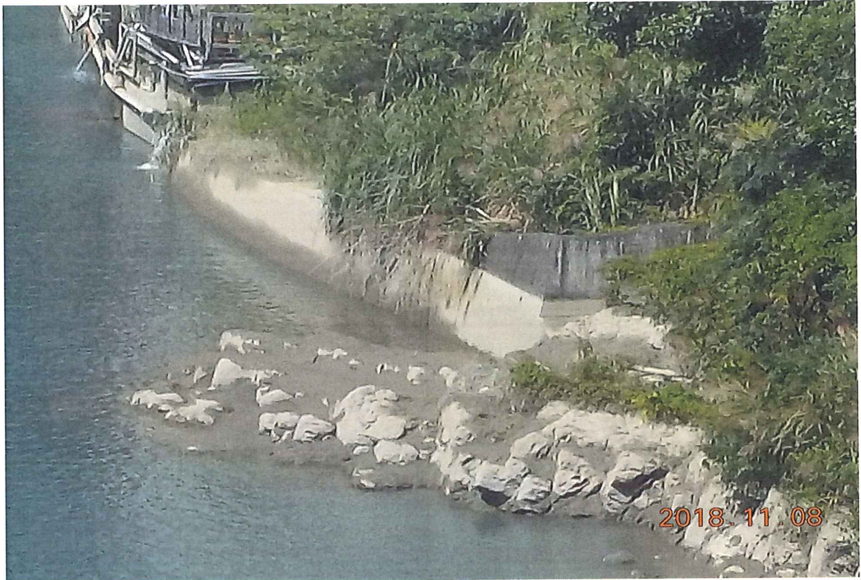
馥蘭朵烏來度假酒店私設建造物設施現況