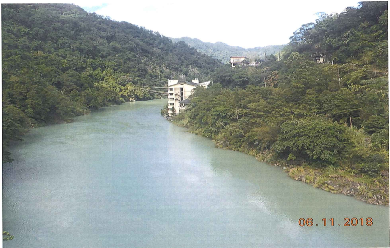
馥蘭朵烏來度假酒店私設建造物設施在南勢溪高水位現況