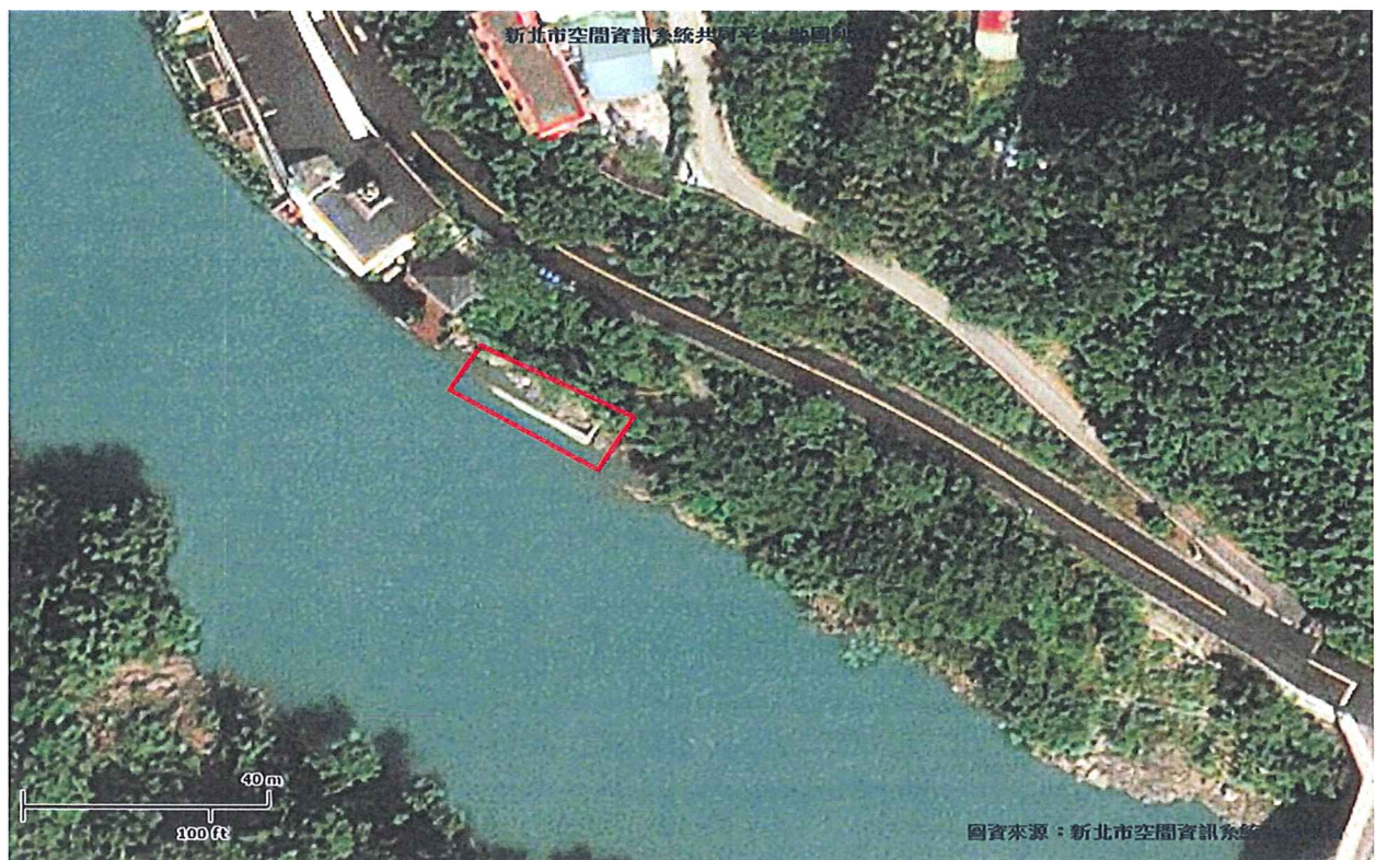
馥蘭朵烏來度假酒店私設建造物設施與鄰近道路相對位置