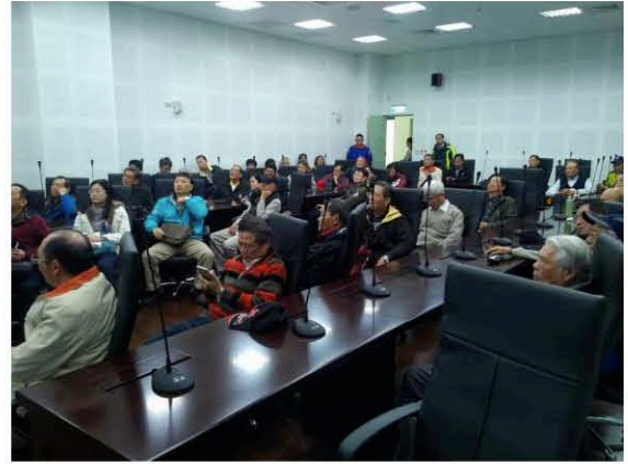
湖山淨水場多媒體簡介