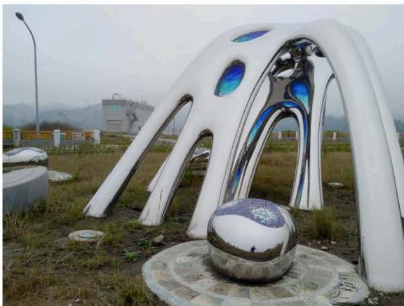
湖山水庫優美景色與藝術造景