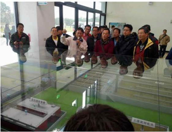
湖山淨水場模型解說