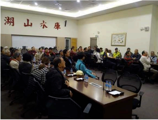
聽取湖山水庫管理單位簡報