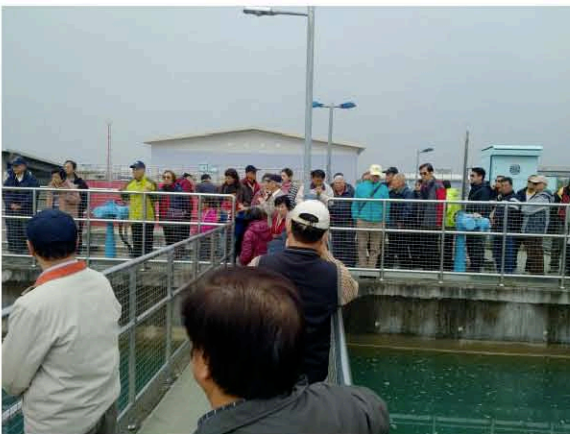
湖山淨水場現場解說