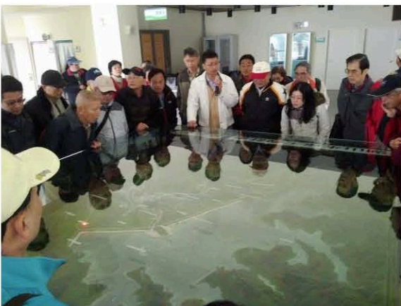
湖山水庫模型導覽解說