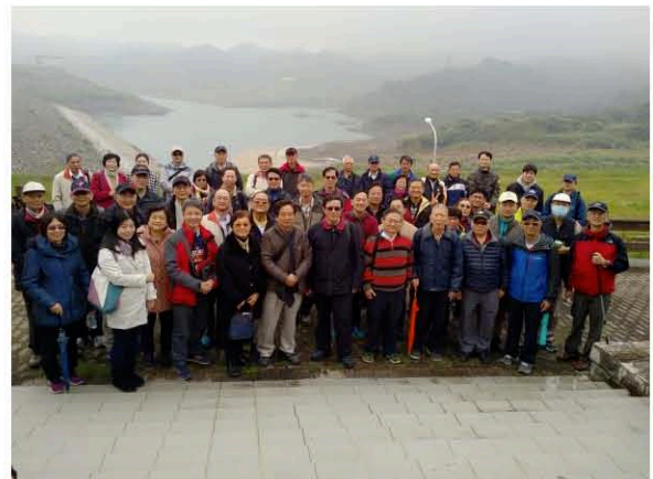
參訪者湖山水庫現場合照