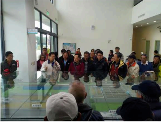
湖山淨水場模型解說