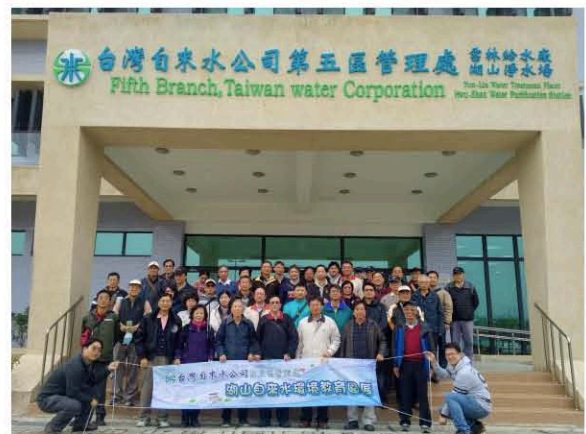
參訪者湖山淨水場合照