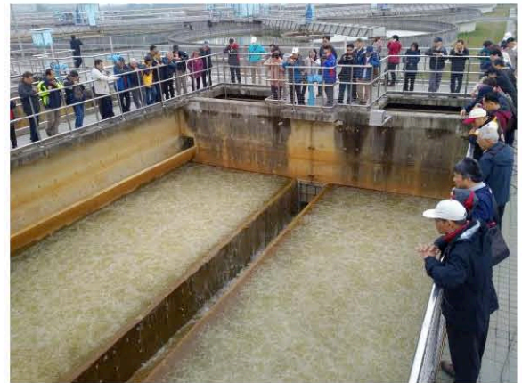
參觀淨水場過濾池逆洗作業