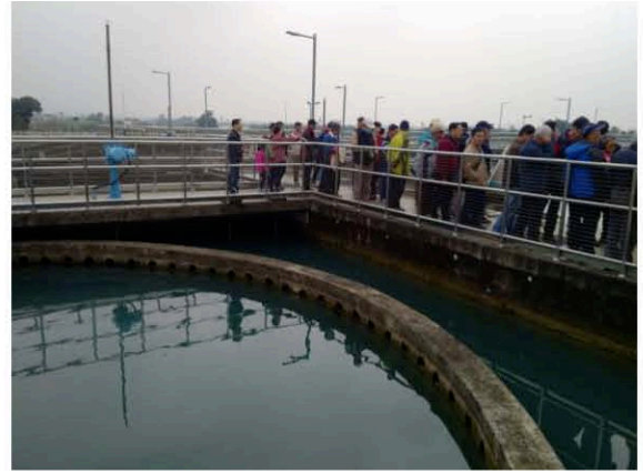
湖山淨水場現場解說