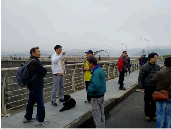
湖山水庫現地解說及經驗交流