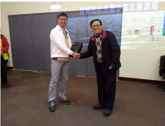
公會致贈湖山水庫管理中心紀念品