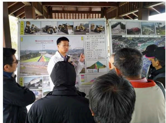
湖山水庫現場解說