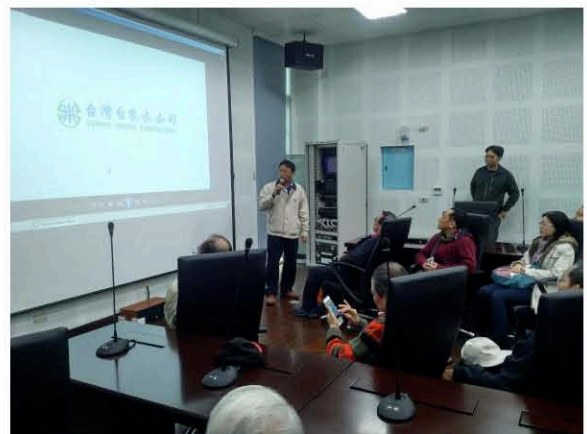
湖山淨水場專人介紹解說