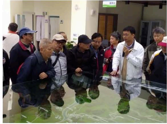
湖山水庫模型導覽解說